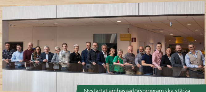
Nystartat ambassadörsprogram ska stärka ICA-handlare som talespersoner.