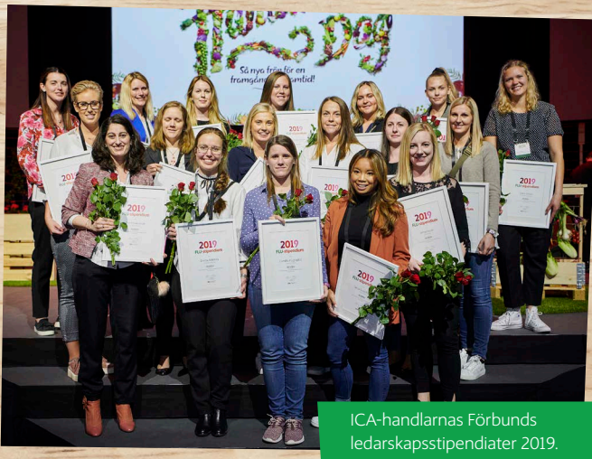
ICA-handlarnas Förbunds ledarskapsstipendiater 2019.