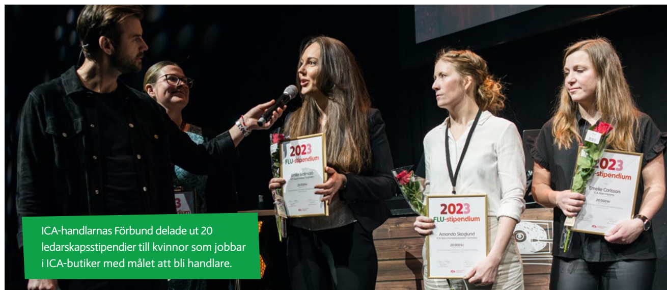
ICA-handlarnas Förbund delade ut 20 ledarskapsstipendier till kvinnor som jobbar i ICA-butiker med målet att bli handlare.

Handlarbuddies: 160 ICA-handlare har under 2023 deltagit i initiativet ICA Buddies, ett mentorprogram inom ICA där handlare paras ihop med ledare inom något av ICA:s bolag i Sverige. Detta för att bygga långsiktiga relationer mellan handlarna och koncernen och öka förståelsen för de olika rollerna inom ICA.