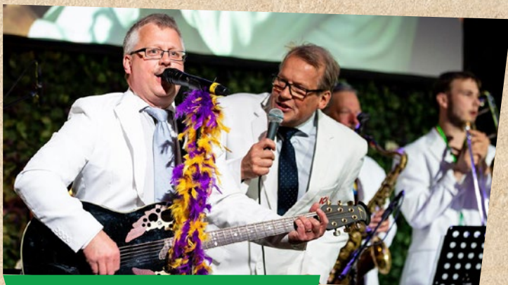
ICA firar 103 år med digitalt födelsedagsnack.

320 av 1488 medlemmar, det vill säga nära 22 procent, i ICA-handlarnas Förbund är kvinnor per 31 december 2020. Andelen kvinnor ökar sakta men säkert.