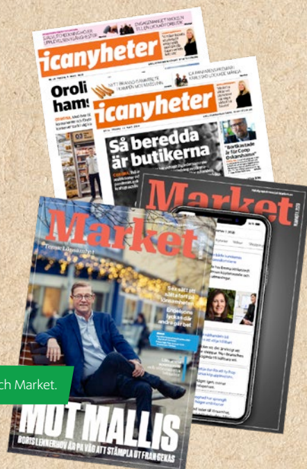
Bonnier News tar över Icanyheter och Market.