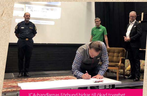
ICA-handlarnas Förbund bidrar till ökad trygghet genom samarbeten mellan kommuner, polis och andra lokala aktörer.

Var femte ny medlem är resultatet av ett generationsskifte och 30 procent av de nya medlemmarna är kvinnor.