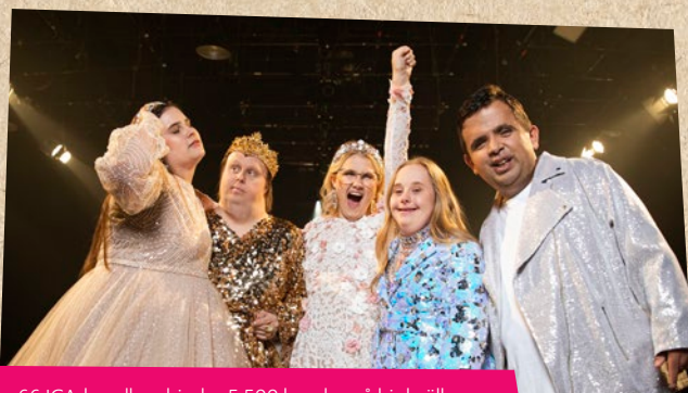
66 ICA-handlare bjuder 5 500 kunder på biokvällar med filmen Catwalk – Från Glada Hudik till New York.