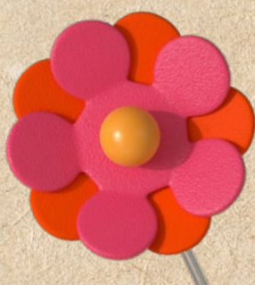
Sveriges ICA-handlare donerar 20 miljoner kronor till Majblomman.

74 av totalt 1 270 ICA-butiker får nya ägare under 2020.